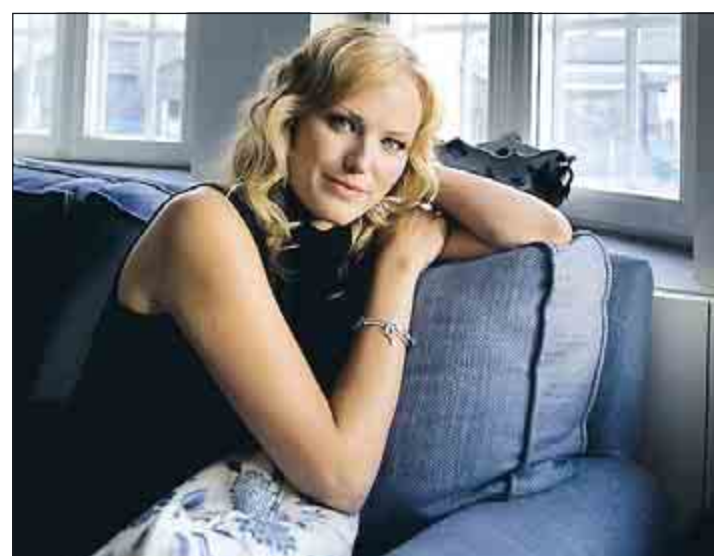
Malin Åkerman flyttade som barn till Kanada men pratar fortfarande perfekt svenska. I morgon är det svensk premiär för hennes nya film 27 dresses bland annat på Röda Kvarn i Nyköping.

– Av två skäl. Dels tack vare rollerna; i Heartbreak kid spelade jag en galen kvinna som dessutom blev rätt ful. Dessutom har jag gjort Watchmen nu, och där var jag brunett. När jag gick in på möten med brunt hår var skillnaden stor. Det var inte