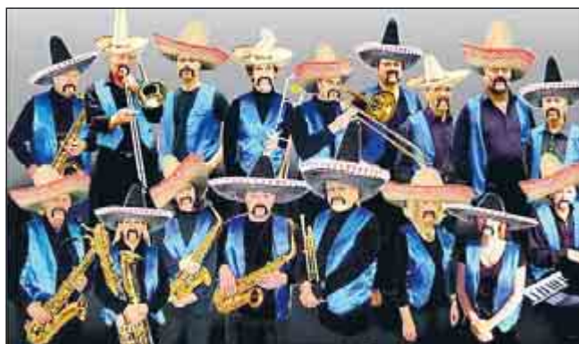
Trosa storband satsar på latinamerikanska rytmer.