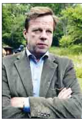
Krister Henriksson blir Kurt Wallander igen.

Den än så länge namnlösa första Wallanderfilmen går upp på bio nästa vår. Övriga tolv filmer släpps bara på dvd, men kommer också att visas på TV 4 och Canal Plus. (TT Spektra)